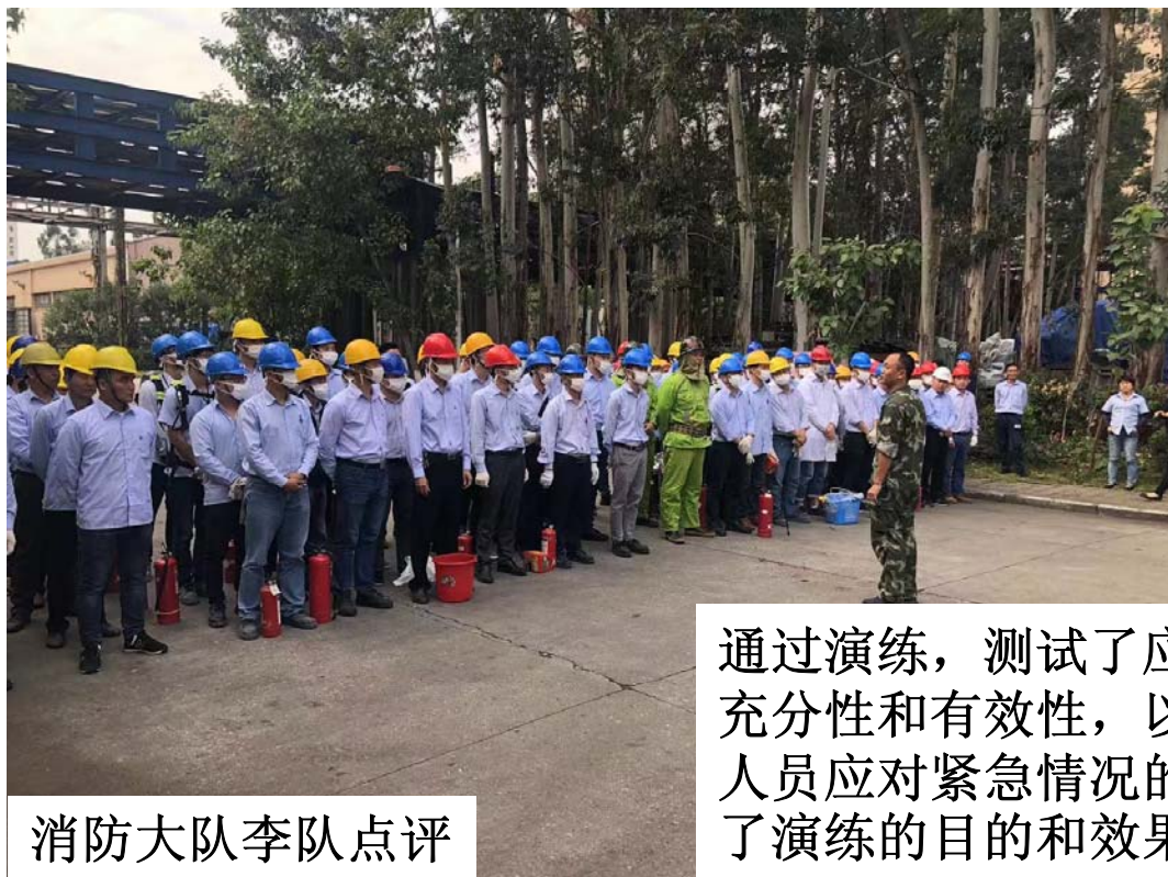
消防大队李队点评

通过演练，测试了应急管理系统充分性和有效性，以及公司各级人员应对紧急情况的能力，达到了演练的目的和效果