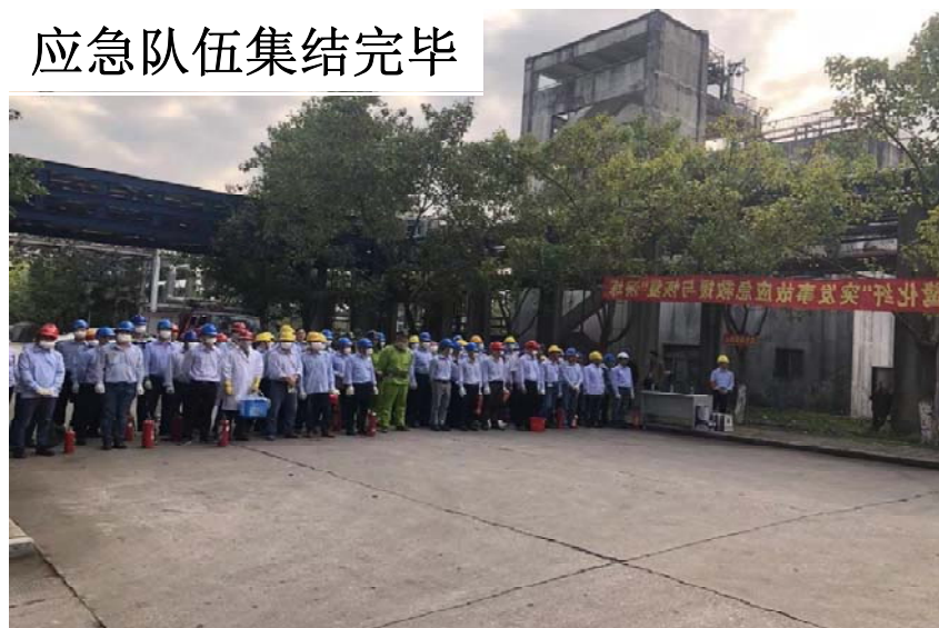
应急队伍集结完毕