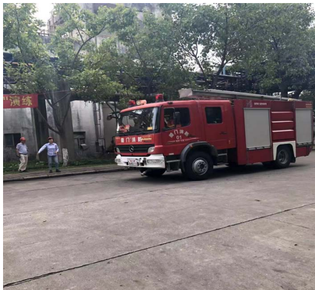
海沧消防大队赶来支援

15: 23: 00 海沧消防大队消防车抵达事故现场，环安课负责向消防队长报告火灾情况，讲解燃烧物质特性，请消防大队抢险支援；