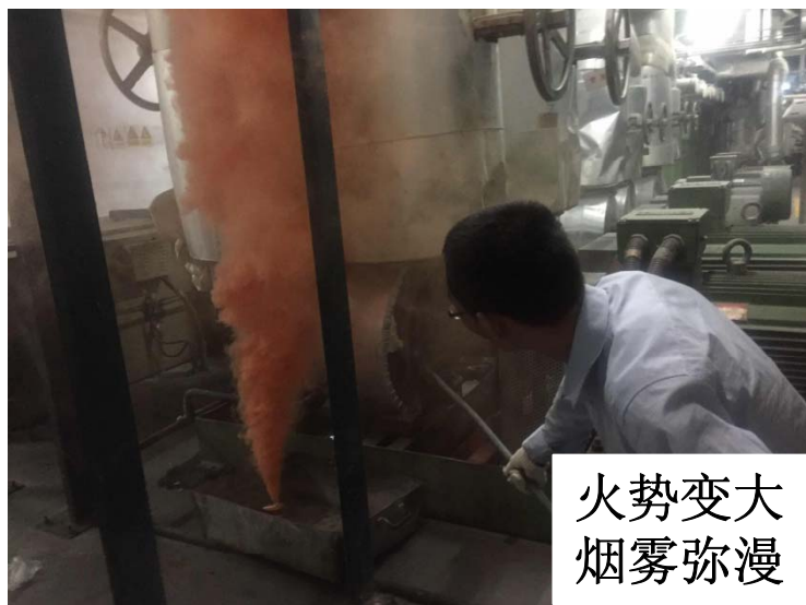
火势变大 烟雾弥漫