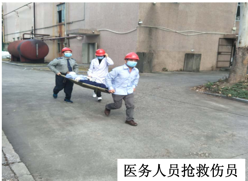
医务人员抢救伤员

15: 15: 30 总指挥立即指令：医务人员到位后立即救护伤员（由总务2人、医务人员1人用担架把受伤人员护送至救护车，送往医院）；